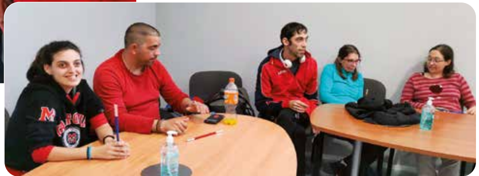
Assistents a "Màgia com a eix d'autoestima"