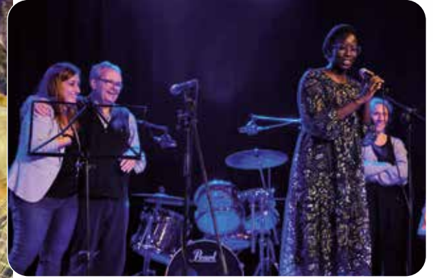
Recull d'imatges de la festa de la Fundació