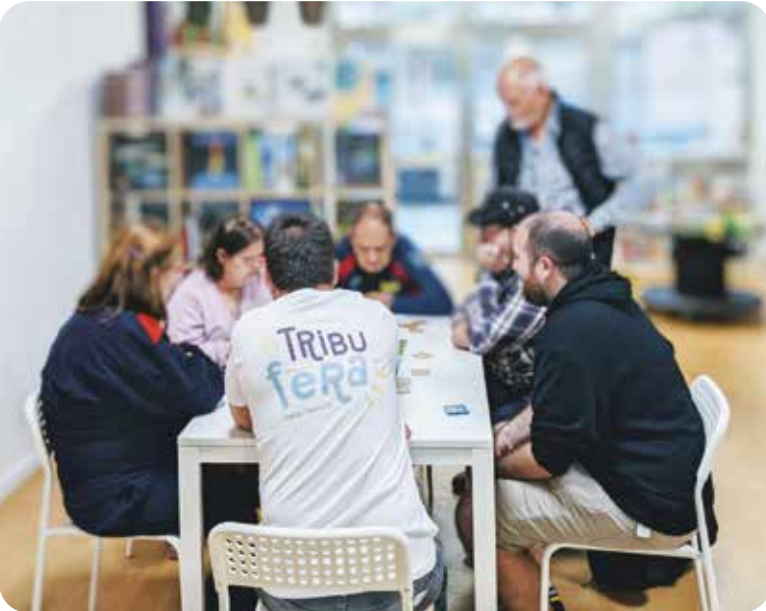
Participants en el projecte de "Cartes i Daus"