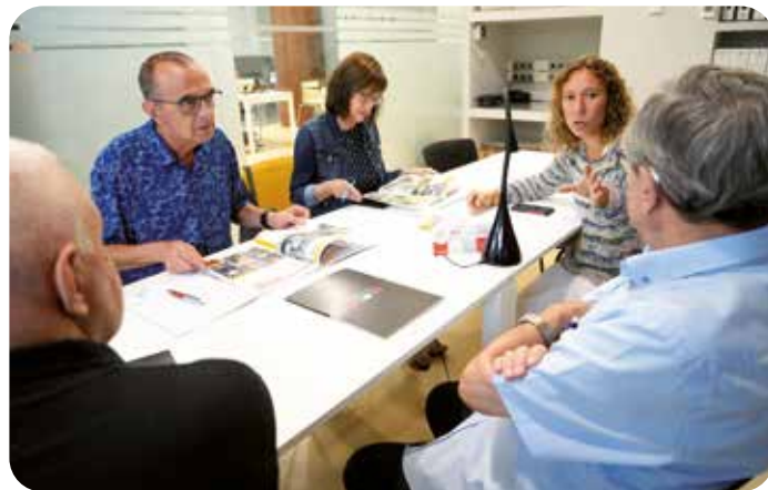
L'alcalde i la regidora de l'Ajuntament de Lleida i personal de la Fundació en la seva visita a la nova oficina d'Alosa