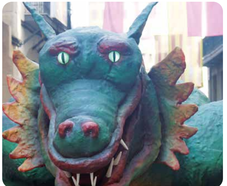
El Marraco, un dels símbols de Lleida

Volem agrair tot el suport i la tasca de voluntariat que porten a terme els voluntaris i les voluntàries a la Fundació, ja que són un pilar molt important per a totes aquelles persones a qui acompanyen en el seu dia a dia i en diferents activitats d'oci.