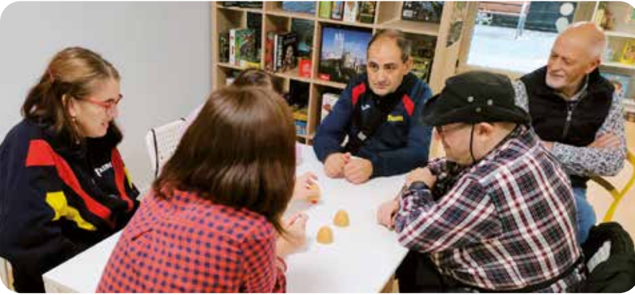
El voluntariat s'aplica a les activitats de lleure