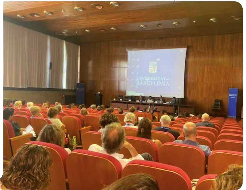
El Congrés es va celebrar a la Facultat de Dret de la Universitat de Barcelona