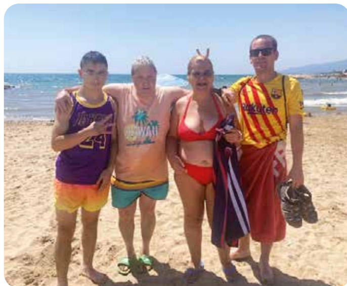
A Cambrils, amb els usuaris de Sant Joan de Déu