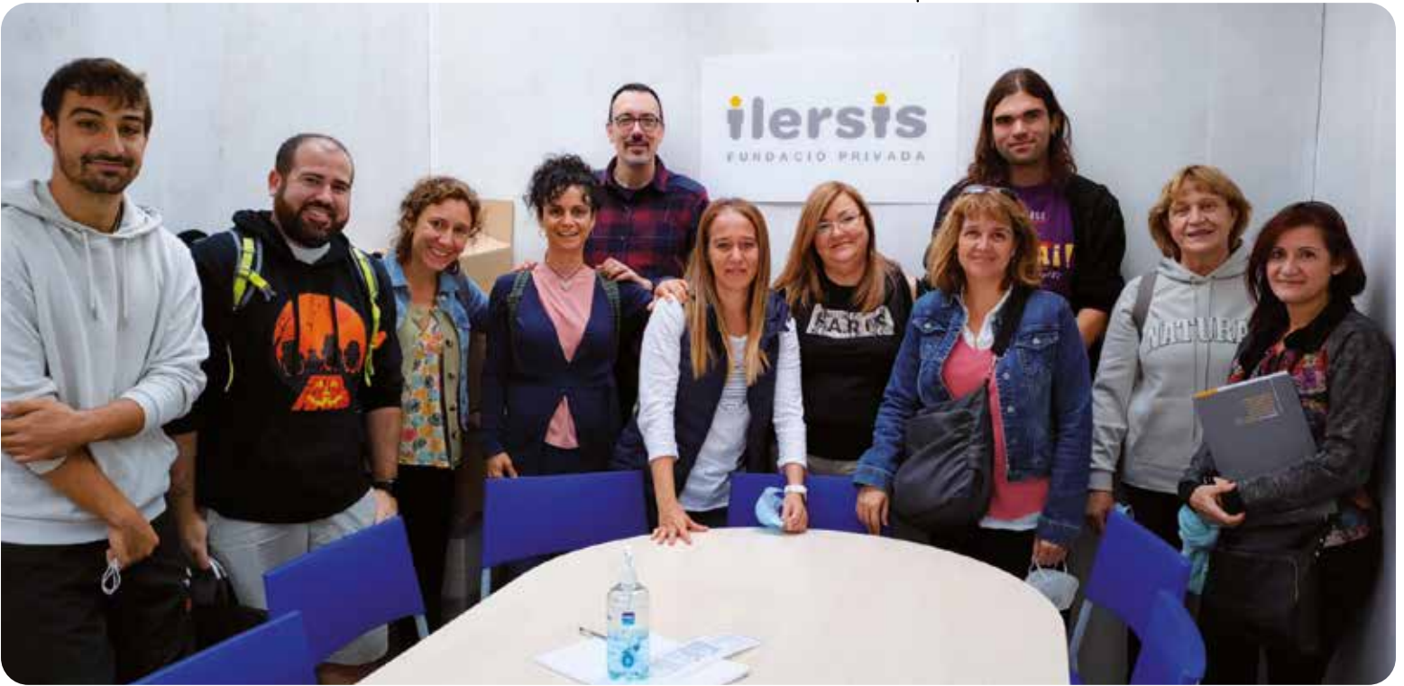
Els assistents de la Fundació a la Jornada de Treballadors i Treballadores