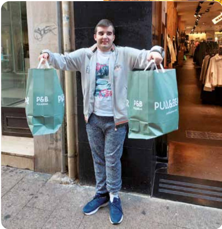
Preparant-nos per a l'arribada del fred!