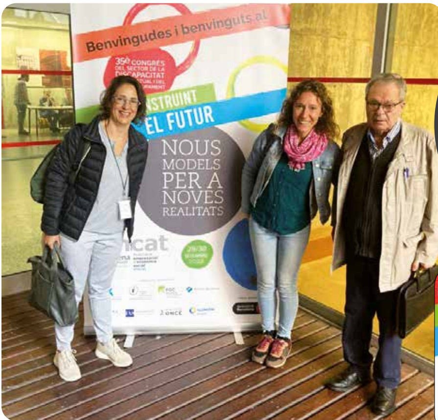
Els membres de la Fundació que van assistir al Congrés organitzat per Dincat